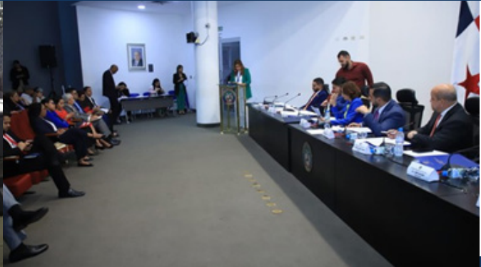
Prohijamiento del Anteproyecto de Ley 150 Que declara el Día Nacional del Sobreviviente de cáncer en Panamá, el día 3 de junio de cada año.