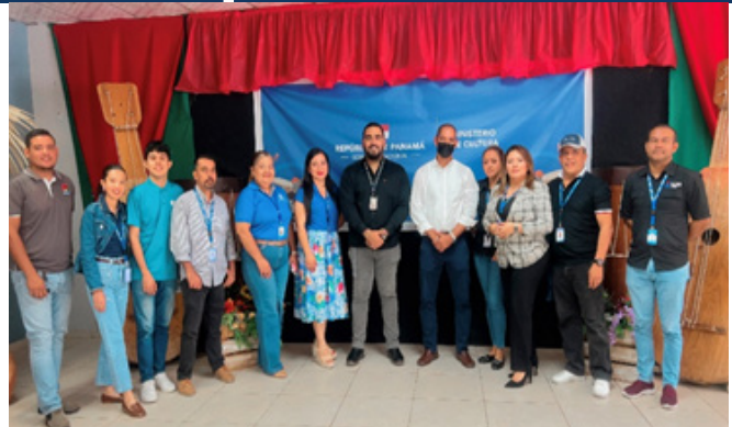
16 de julio de 2025. Capacitación en el Ministerio de Cultura.

Julio inició con un ciclo de webinars en la UNACHI y capacitaciones en instituciones como el IPHE, la Junta Comunal de Boca de Monte, San Isidro y la Policlínica Gustavo A. Ross en David. Se realizaron talleres con estudiantes de la UMECIT, quienes presentaron propuestas ciudadanas innovadoras. También se hicieron promociones en INADEH, visitas de seguimiento en Bugaba y capacitaciones en el Ministerio de Cultura.