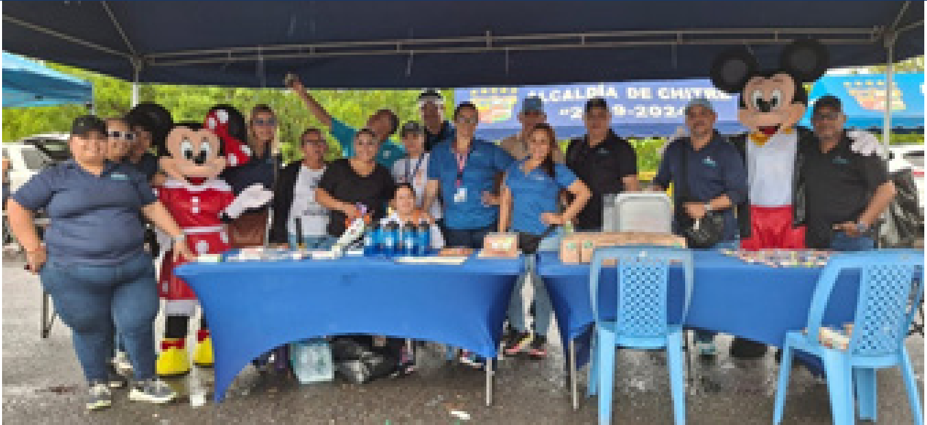
Invitación por la Autoridad de la Micro, Pequeña y Mediana Empresa (AMPYME)