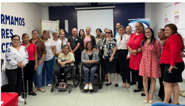
23 de julio de 2025. Capacitación Mides (grupos asociativos organizados de personas con discapacidad)

Durante este trimestre, la Dirección de Participación Ciudadana Regional Chiriquí realizó múltiples capacitaciones y actividades de promoción en instituciones públicas, universidades y comunidades. El objetivo fue brindar herramientas sobre el funcionamiento legislativo y los mecanismos de propuestas ciudadanas.