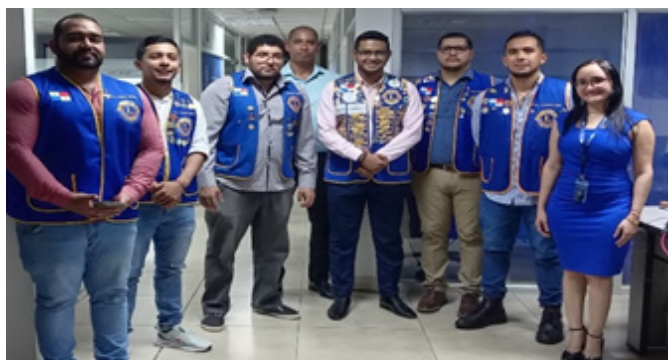
4 de septiembre de 2025. Capacitación a miembros del Club Universitarios de Leones de David.