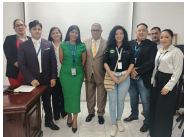
28 de agosto de 2025. Foro de Participación Ciudadana como Mecanismo de Acción en el Cooperativismo en el IPACOOOP

En el mes de agosto, continuaron la senda de acercamiento y capacitación con diversas actividades que abarcaron desde promociones comunitarias hasta eventos clave y la presentación de propuestas ciudadanas, destacando la evolución hacia la participación en la era digital.