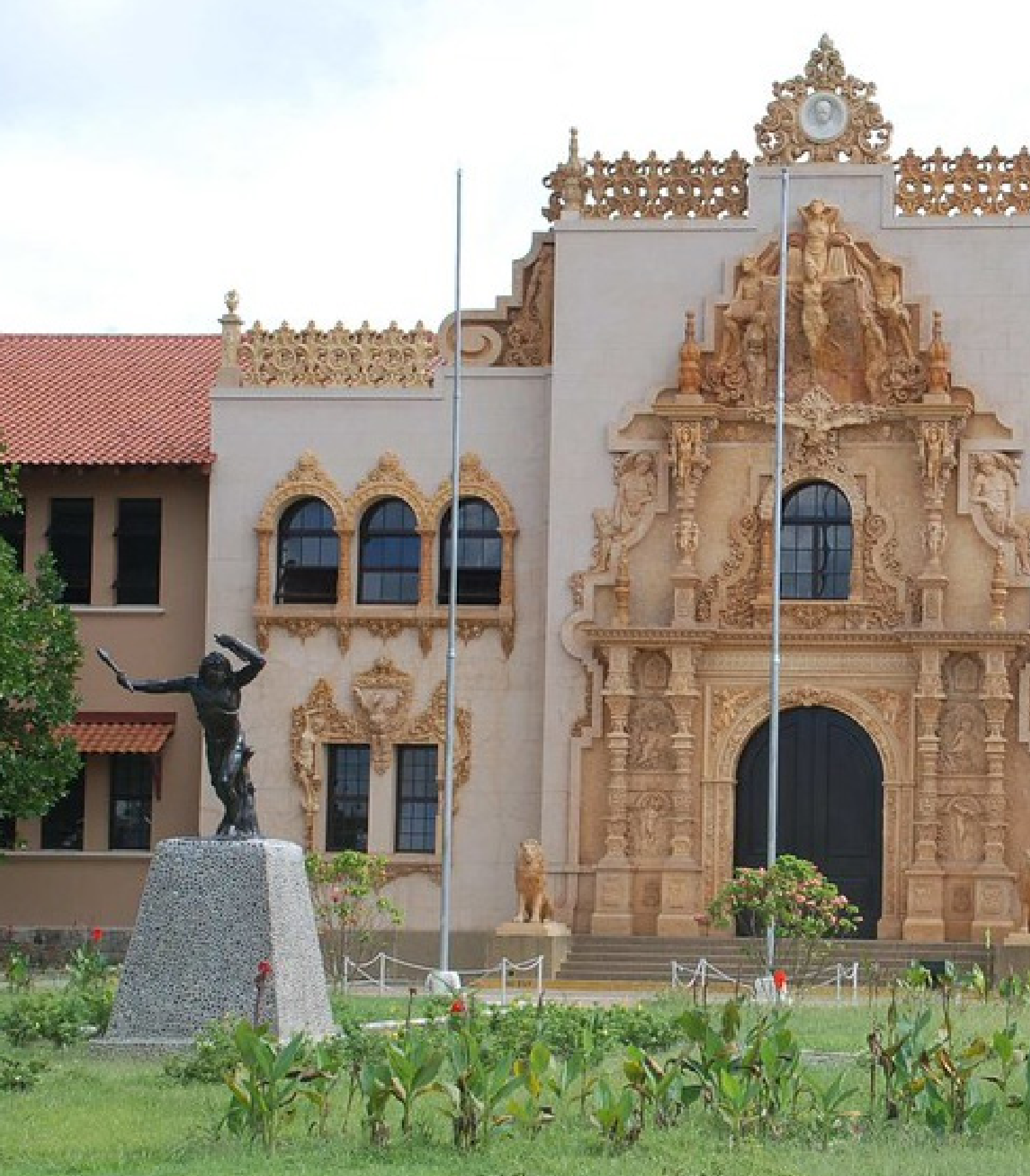
ESCUELA NORMAL DE SANTIAGO