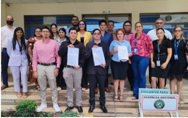
Viernes 11 de julio en el Taller: Fomentar la Cultura Participativa UMECIT

a los ciudadanos. Agradecemos profundamente a cada institución, comunidad, estudiantes y colaboradores que participaron en estas acciones, demostrando que juntos podemos construir un país con mayor participación activa e informada.