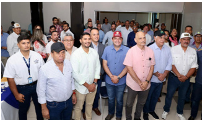
16 de agosto de 2025. Entrega de Gestión de Fiscalización de Obras Públicas en la provincia de Chiriquí, de la Comisión de Infraestructura Pública y Asuntos del Canal.

Durante el mes de agosto, se llevaron a cabo importantes actividades de promoción y capacitación en el MIDES, UDELAS e IPACOOOP, así como la participación en ferias comunitarias y eventos provinciales como el Festival de las Fresas y la Gira Nacional Panamá–Mercosur. El trabajo incluyó acercamiento a universidades y comunidades, consolidando alianzas estratégicas. Un hito importante fue el taller en la Facultad de Derecho de la UNACHI, donde los estudiantes presentaron propuestas enfocadas en la educación ciudadana, el reciclaje y el uso ético de la inteligencia artificial.