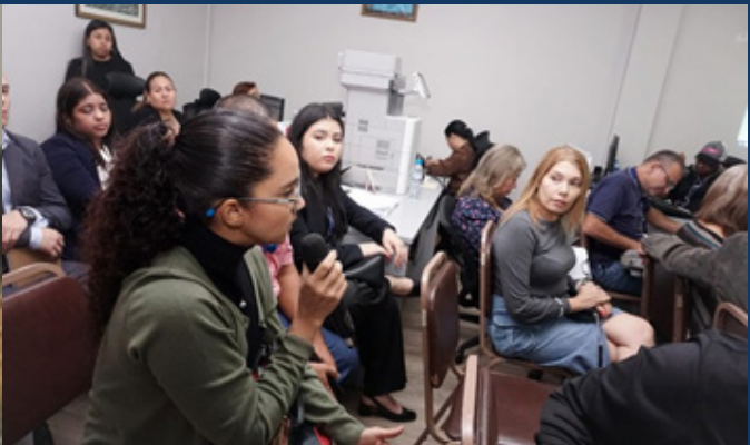
Análisis y discusión del Anteproyecto de Ley 316 Que adiciona artículos a la Ley 70 de 2012.