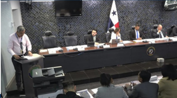
Prohijamiento del Anteproyecto de Ley 68 Que modifica un artículo de la Ley 187 de 2 de diciembre de 2020.