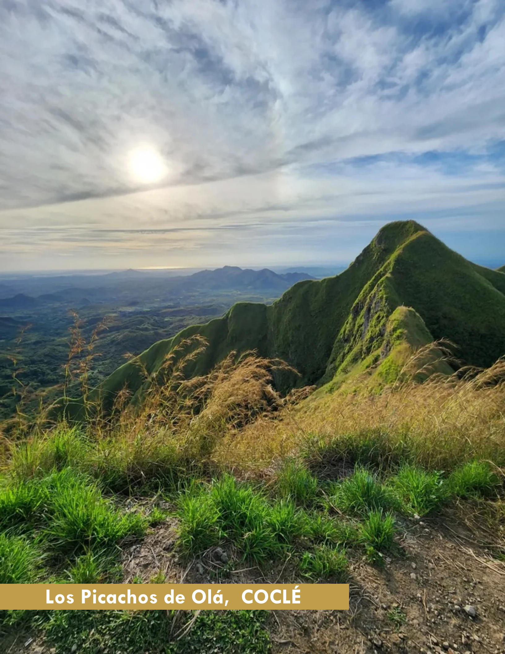
Los Picachos de Olá, COCLÉ