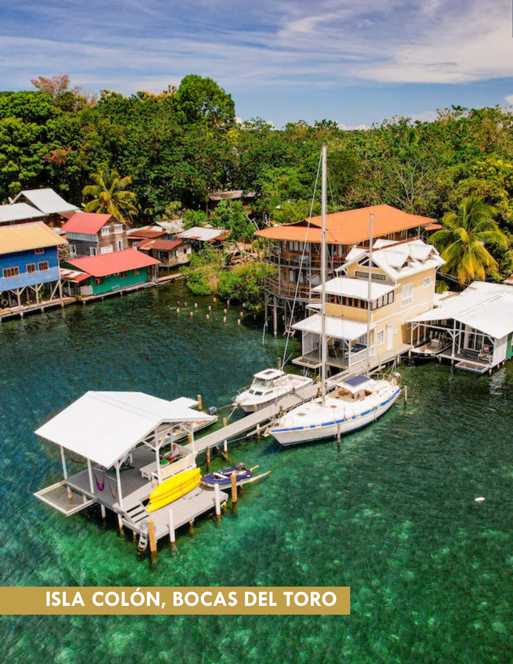
ISLA COLÓN, BOCAS DEL TORO