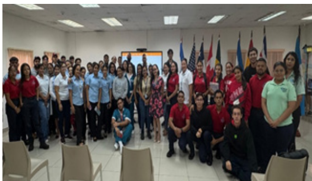
1 de septiembre de 2025. Capacitación en Universidad de las Américas, sede David.