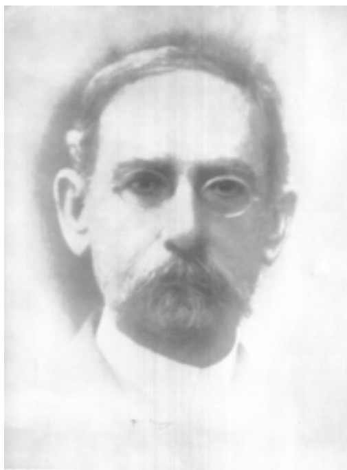
Dr. PABLO AROSEMENA