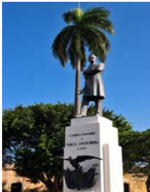
Estatua de Pablo Arosemena Las Bóvedas en la Plaza de Francia del Casco Antiguo o Casco Viejo de la Ciudad de Panamá