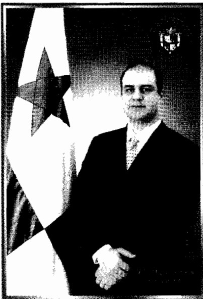
H.D. Miguel Alemán Vice Presidente