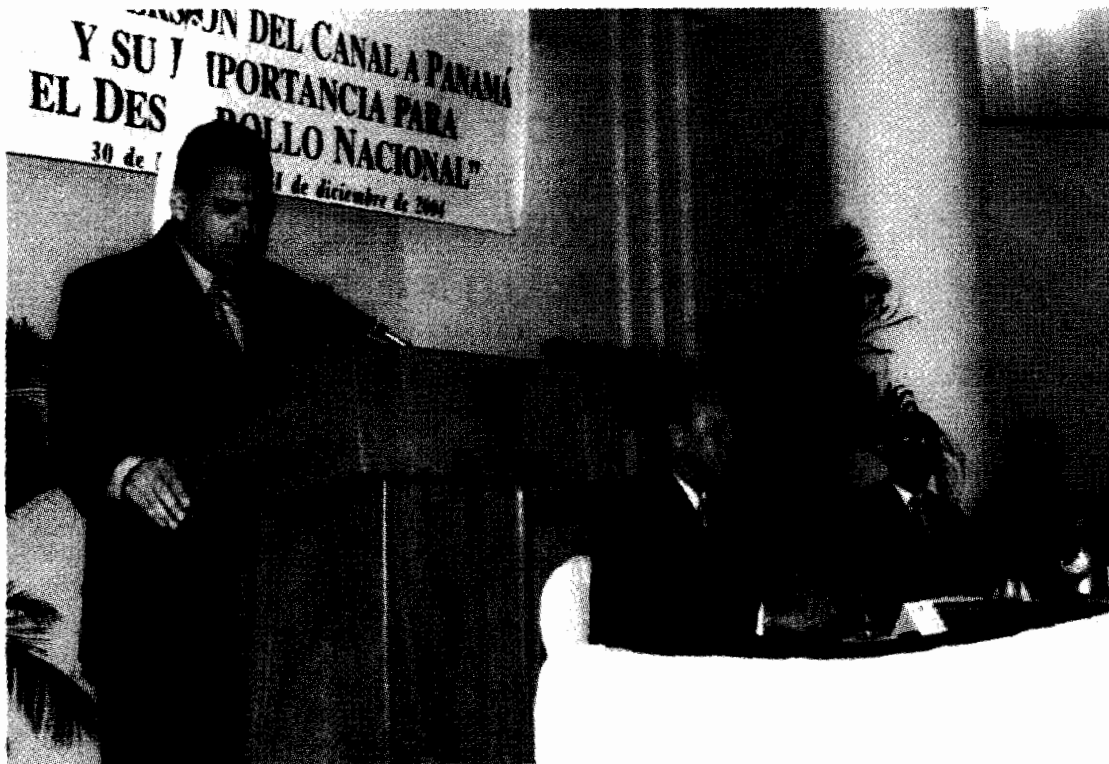
S.E. Rubén Arosemena Valdés, Inaugurando formalmente el Foro.