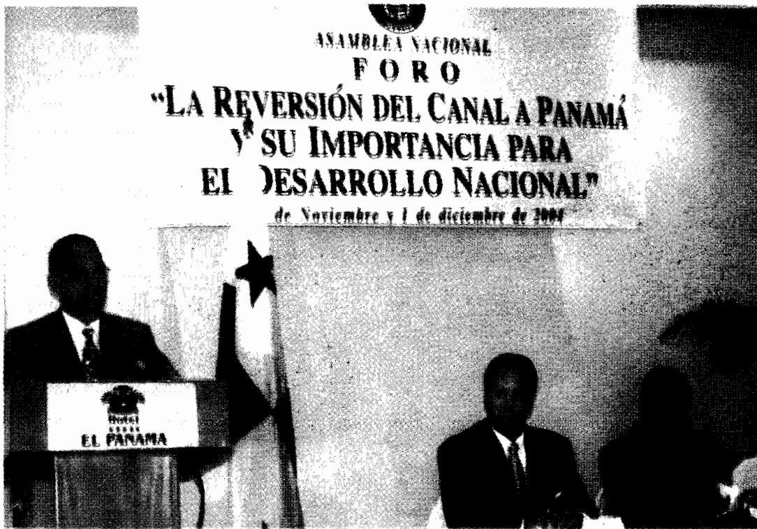
El Presidente de la Asamblea Nacional (2003-2004) H.D. Jerry Wilson Navarro.