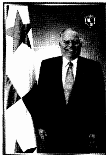
H.D. Leopoldo Benedetti Comisionado